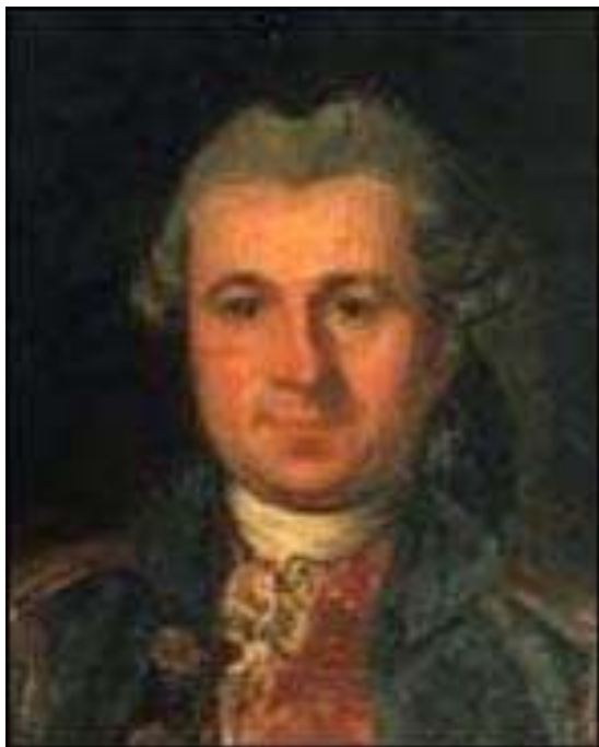
1 - Yves-Joseph de Kerguelen-Trémarec

Quels parcours effectue l'explorateur ? Quels sont les objectifs et les apports de ces voyages ?