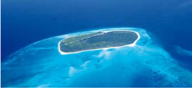
Lagon aux îles Glorieuses.