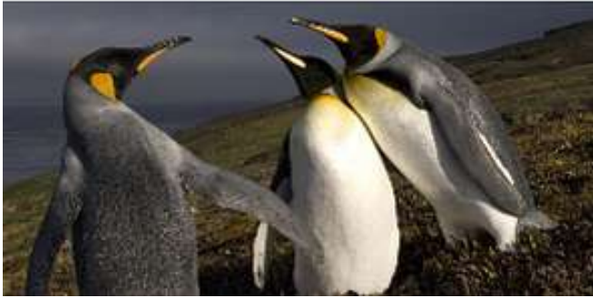
Manchots royaux à l'île Crozet