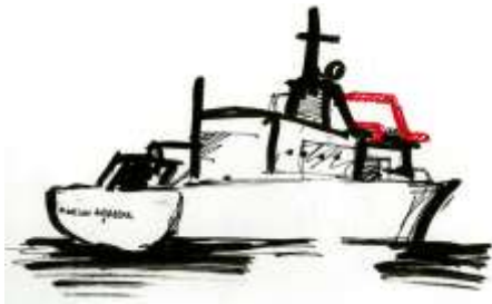
Le Marion Dufresne, navire logistique et scientifique

Les Taaf ont créé depuis 2006 d'immenses réserves naturelles dans les îles australes. En protégeant des écosystèmes terrestres et marins exceptionnels, elles permettent aux chercheurs de continuer à mener des travaux pour la connaissance et la protection de la biodiversité mondiale. Des études climatiques et océanographiques sont aussi menées dans ces territoires grâce à des stations terrestres, ou sur les océans, grâce au navire Marion Dufresne. D'autre part, Kerguelen abrite une station du Cnes* pour le suivi des satellites européens et internationaux.