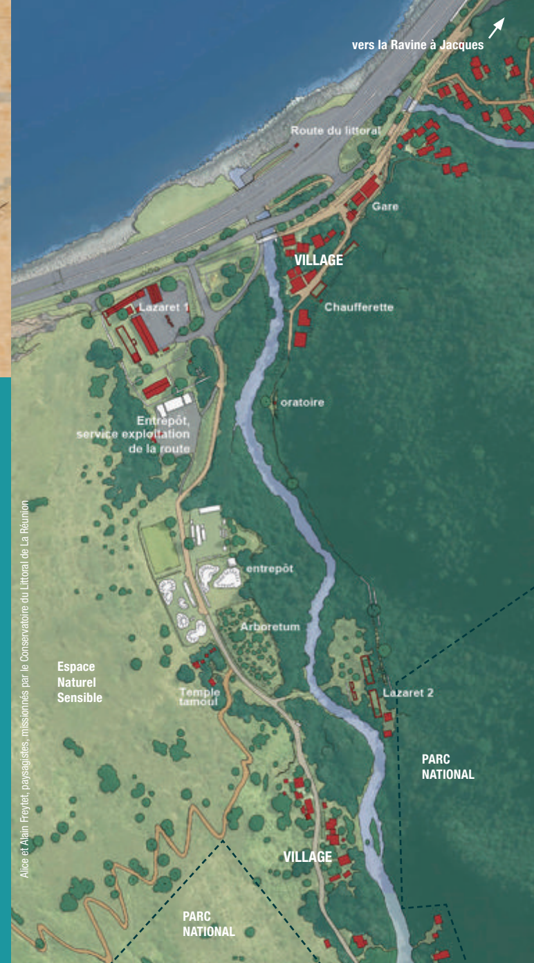
Alice et Alain Froyet, paysagistes, missionnés par le Conservatoire du Littoral de La Réunion

Lieu d'isolement depuis la fin du XVIII e siècle pour les esclaves atteints de variole, il se accueille par la suite les premiers engagés débarquant sur l'île avant d'être remplacé par les lazarets n° 1 et 2.