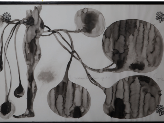
Barthélémy Togo, La toilette de la princesse

COMME SUR CETTE ŒUVRE, À QUOI TE FAIT PENSER LA TRACE LAISSÉE PAR LA GOUTTE D'ENCRE ?