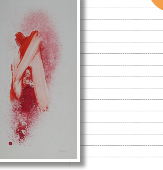
Jean-René Bazaine, Affiche avant Zurich