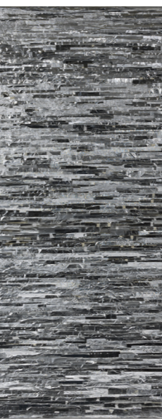
Joël Andrianomearisoa, Tout ça s'envole en fumée (1/3, tryptique)

POUR COMPENSER LA CONSOMMATION DE PAPIER DE TON ÉCOLE, COMBIEN D'ARBRES DEVRIEZ-VOUS PLANTER ?