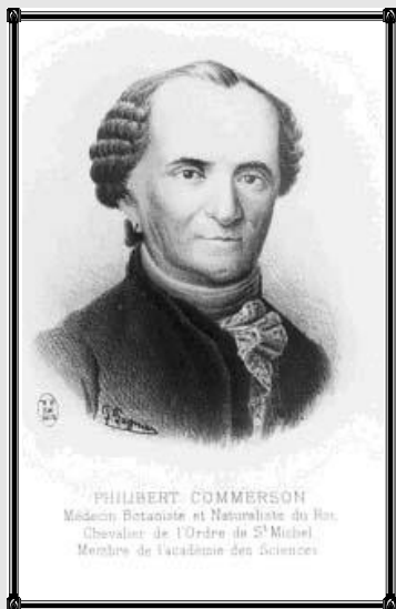
Dictionnaire illustré de La Réunion