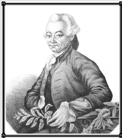
Dictionnaire illustré de La Réunion

Né le trois août 1719, il se destine à la vocation religieuse.