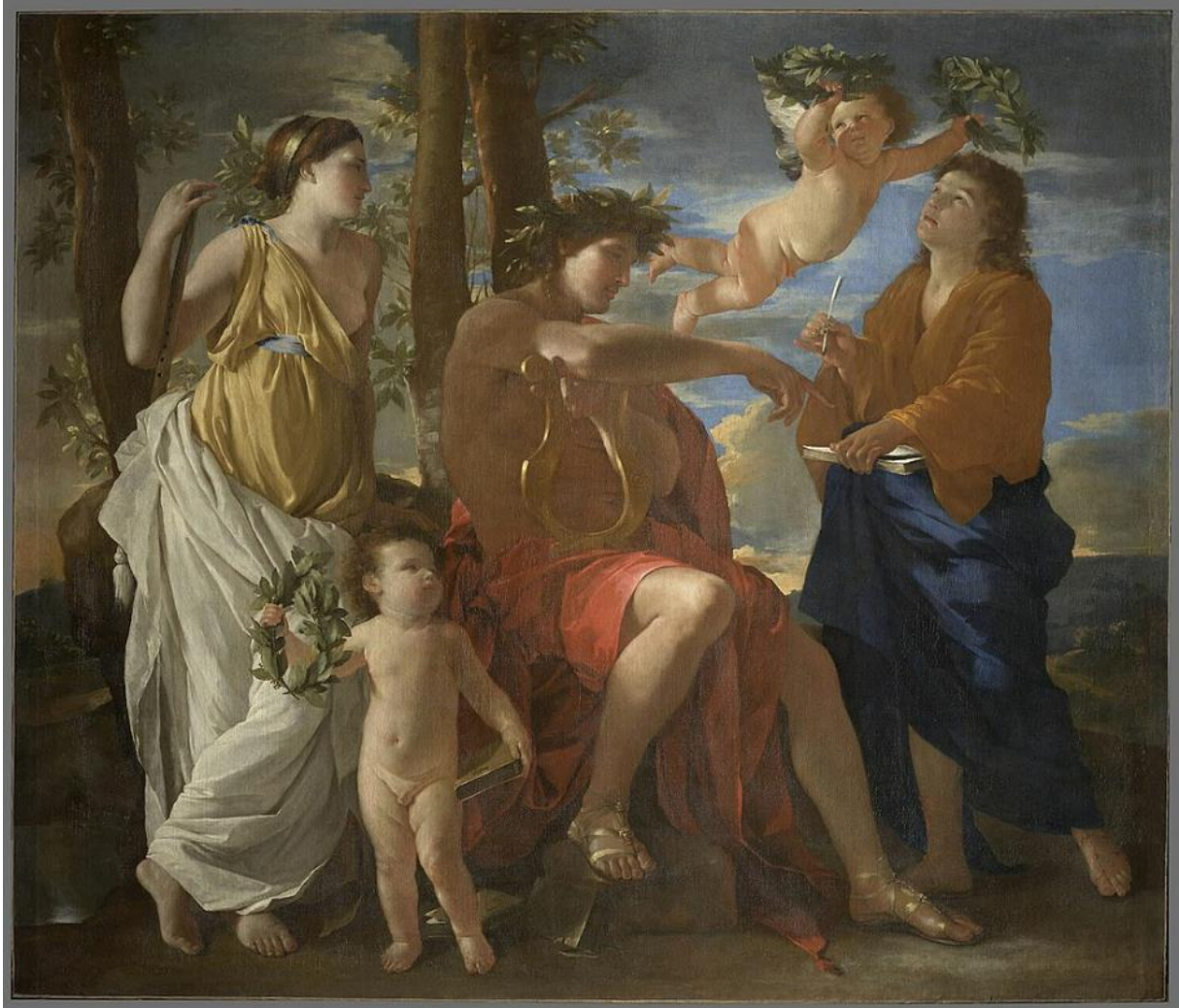
Nicolas Poussin, L'inspiration du poète (1629-1630)